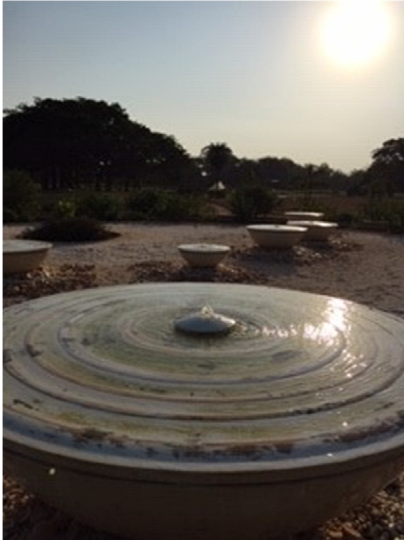
Brunnen im Garten des Matri Mandir, Auroville, Indien

Bach-Arie: Wahrlich, wahrlich, ich sage euch , so ihr den Vater etwas bitten werdet in meinem Namen, so wird er's euch geben. Joh 16,23 (aus Kantate BWV 86)